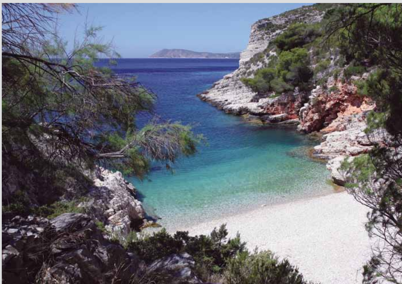
Pritiŝĉina (insulo Vis).