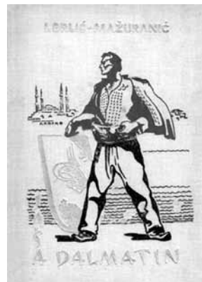
La titolpaĝo de la unua eldono de "Jaša la Dalmato" el 1937.