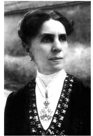
Ivana Brlić-Mažuranić (1874-1938)

Jaša nun eĉ pli insiste komencis peti Viŝkon ke li konigu